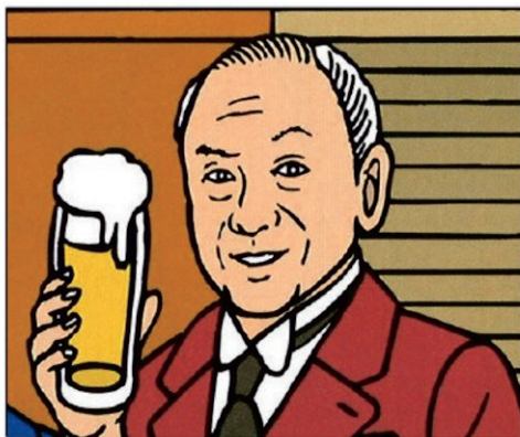
イラスト:坂谷はるか

戦前、日本のビール市場の七割を占めた大日本麦酒株式会社。 その社長を二十八年も務め「東洋のビール王」と呼ばれたのが 馬越恭平。家柄も学歴もなく口八丁手八丁だけで 財界トップに登りつめた破天荒な生涯を、 豊富な逸話をからめて紹介します。